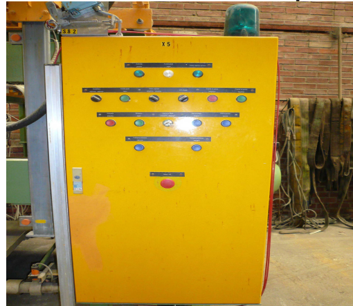
Elektr. Schalttafel / Electric panel